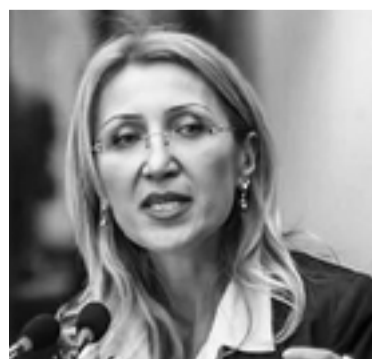
Աշխատանքի և սոցիալական հարցերի նախարար Մանե Թանդիլյան