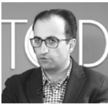
Առողջապահության նախարար Արսեն Թորոսյան