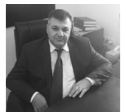
Տրանսպորտի, կապի և ՏՏ նախարար Աշոտ Հակոբյան