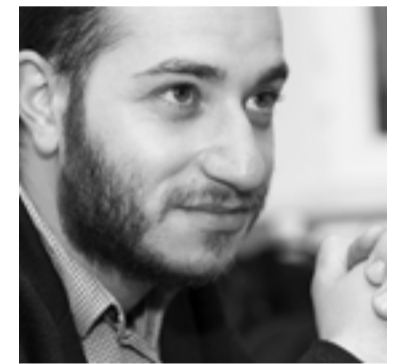
Սփյուռքի նախարար Մխիթար Հայրապետյան