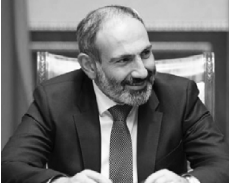
ՀՀ վարչապետ՝ Նիկոլ Փաշինյան