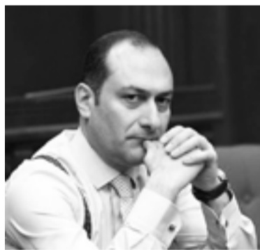
Արդարադատության նախարար Արտակ Ջեյնալյան