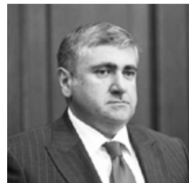
Գյուղատնտեսության նախարար Արթուր Խաչատրյան