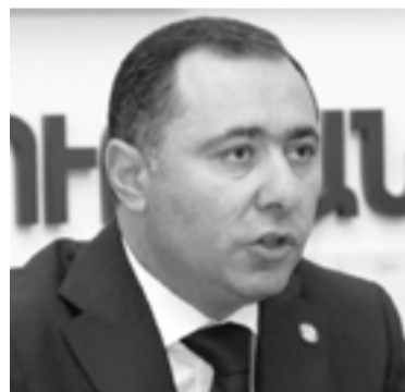
Էներգետիկ ենթակառուցվածքների և բնական պաշարների նախարար Արթուր Գրիգորյան