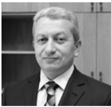
Ֆինանսների նախարար Ատոմ Ջանջուղազյան