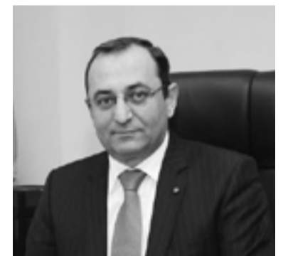
Տնտեսական զարգացման և ներդրումների նախարար Արծվիկ Մինասյան