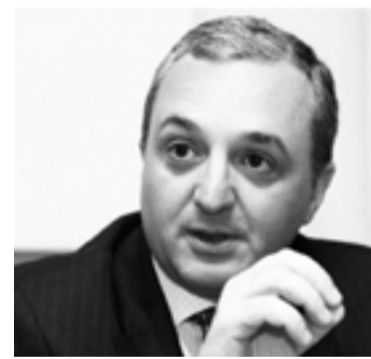
Արտաքին գործերի նախարար Ջոհրաբ Մնացականյան