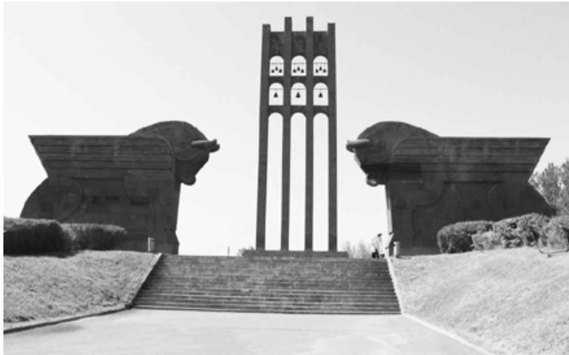
Սարդարապատի հուշահամալիրի մուտք

ԱՐՄԵՆ ԿԱՐԱՊԵՏՅԱՆ Պատմական գիտությունների թեկնածու, ՀՀ ԳԱԱ պատմության ինստիտուտի ավագ գիտաշխատող