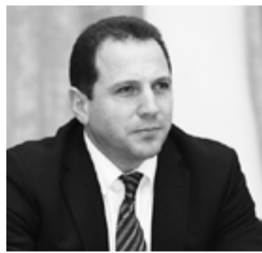
Պաշտպանության նախարար Դավիթ Տոնոյան