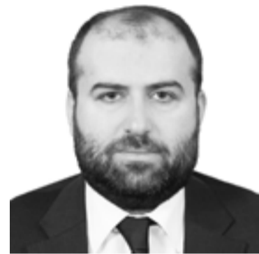
Բնապահպանության նախարար Էրիկ Գրիգորյան