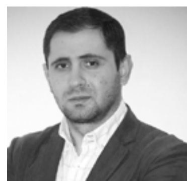
Տարածքային կառավարման և զարգացման նախարար Սուրեն Պապիկյան