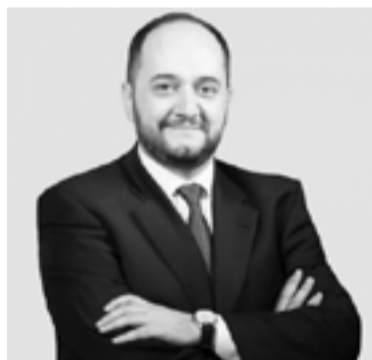
Կրթության և գիտության նախարար Արայիկ Հարությունյան