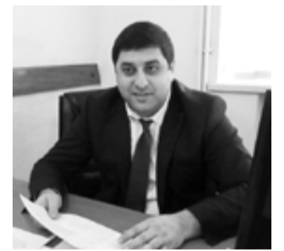
Սպորտի և երիտասարդության հարցերի նախարար Լևոն Վահրադյան