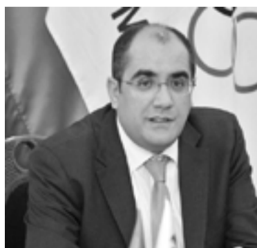
Արտակարգ իրավիճակների նախարար Հրաչյա Ռոստոմյան