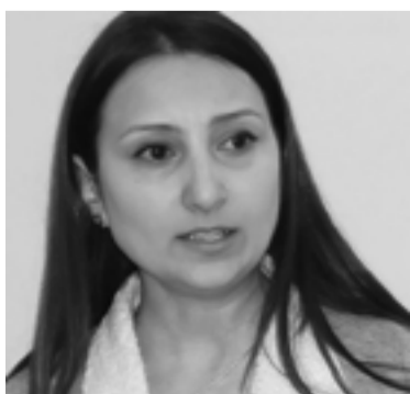
Մշակույթի նախարար Լիլիթ Սակունց