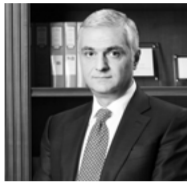
Փոխվարչապետ Միհր Գրիգորյան