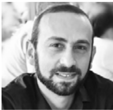
Առաջին փոխվարչապետ Արարատ Միրզոյան